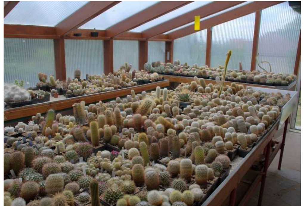
Blick ins Gewächshaus - 1