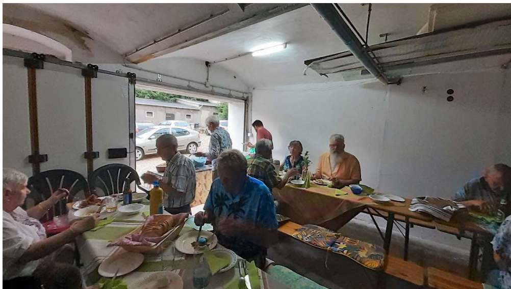
Beim Abendessen in der Garage

Dank an die Gastgeberfamilie Nebel und alle, die einen Beitrag zum gelungenen Tag geleistet haben!