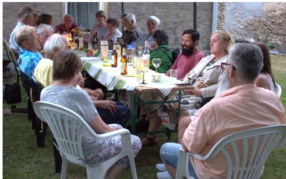
Die abendliche Runde - 1