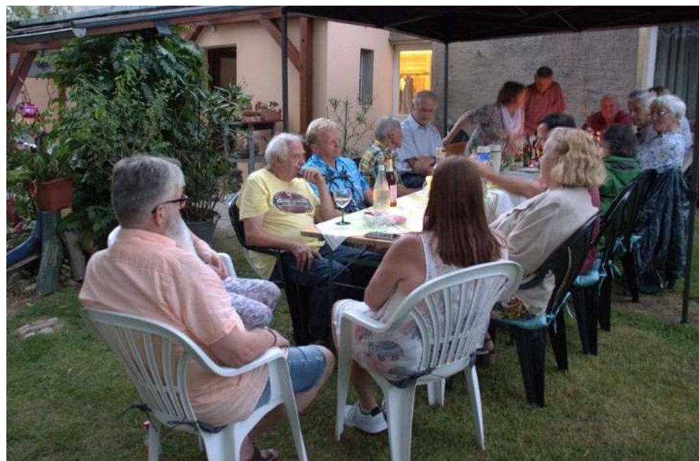
Die abendliche Runde - 2