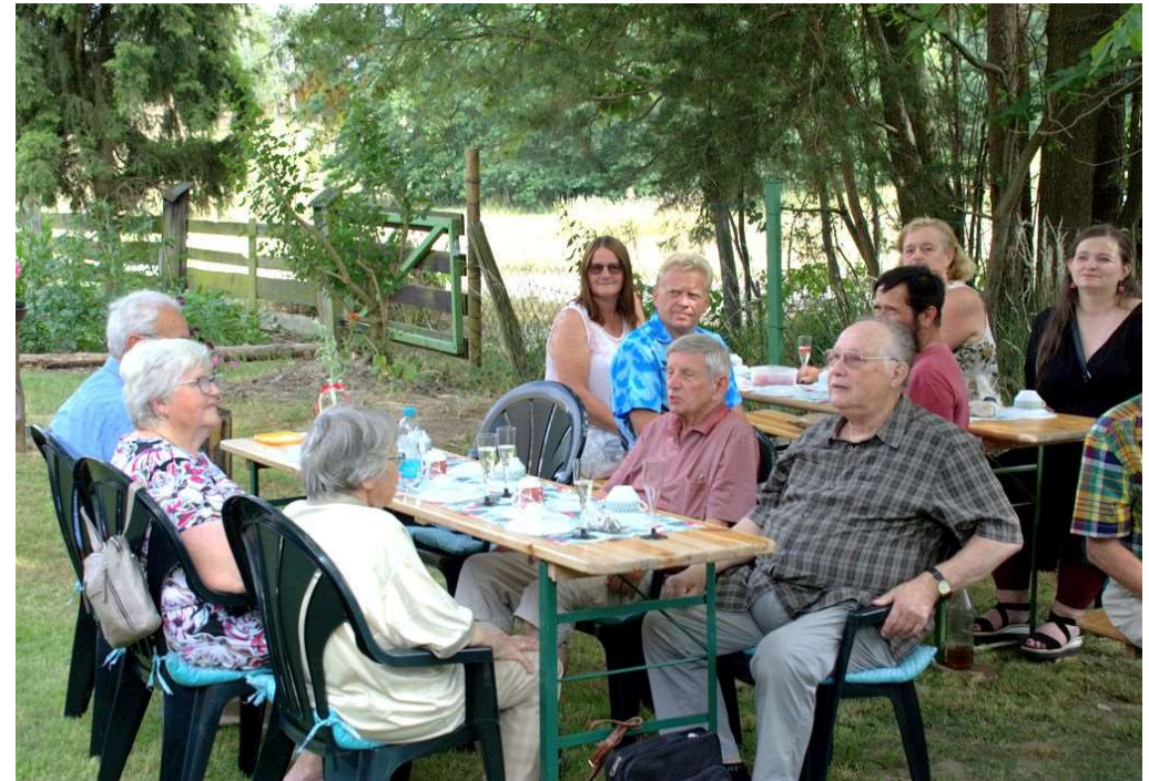
In Erwartung von Kaffee und Kuchen