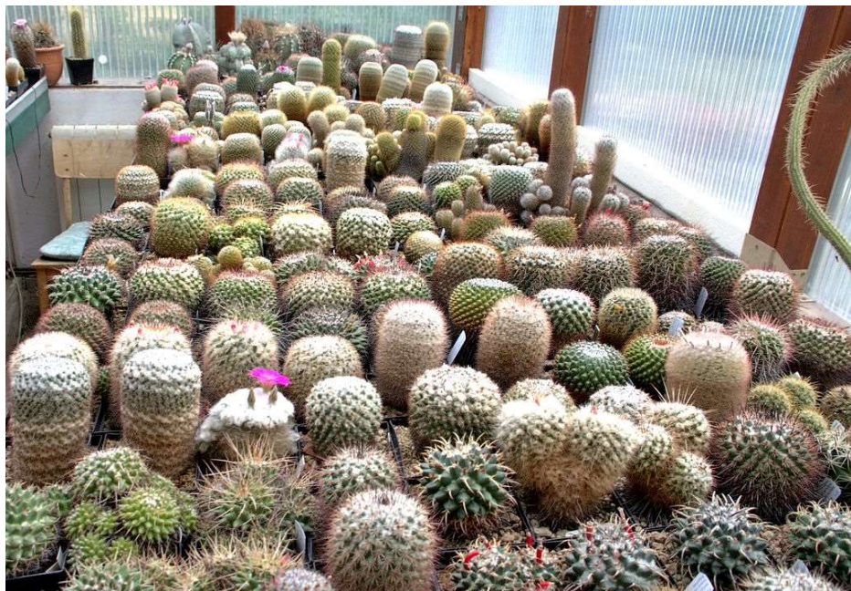
Blick ins Gewächshaus – 2