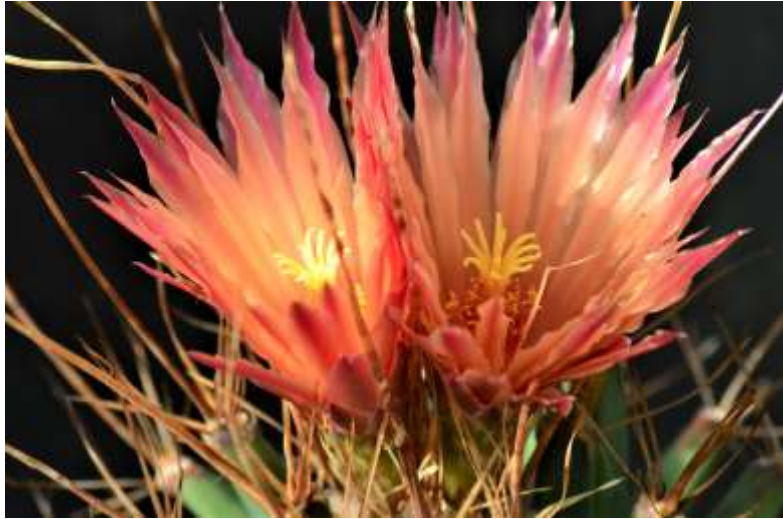
Text und Bild: Karl-Heinz Ulbrich:

Am 11.06.2010 bestäubte ich eine Ferobergia mit Ferocactus fordii . Eine aus einem Sämling gezogene Pflanze blüht Anfang August erstmals. Es ist für mich die bisher schönste Blüte einer Ferobergia !