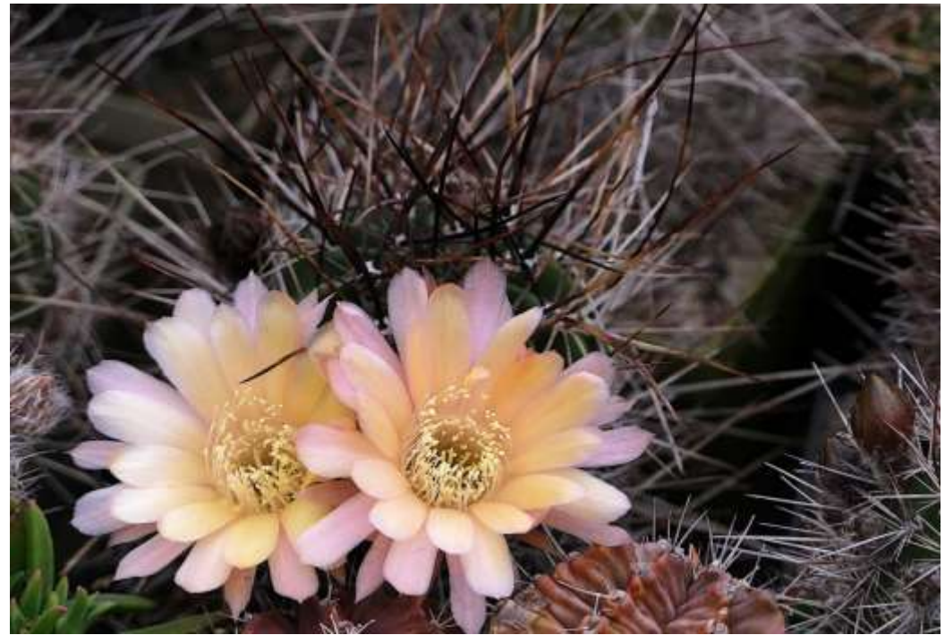
Lobivia ferox var. longispina