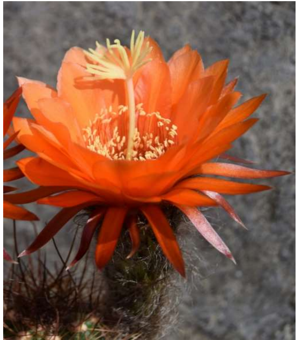
Soehrensia huascha-(Hybride ?)