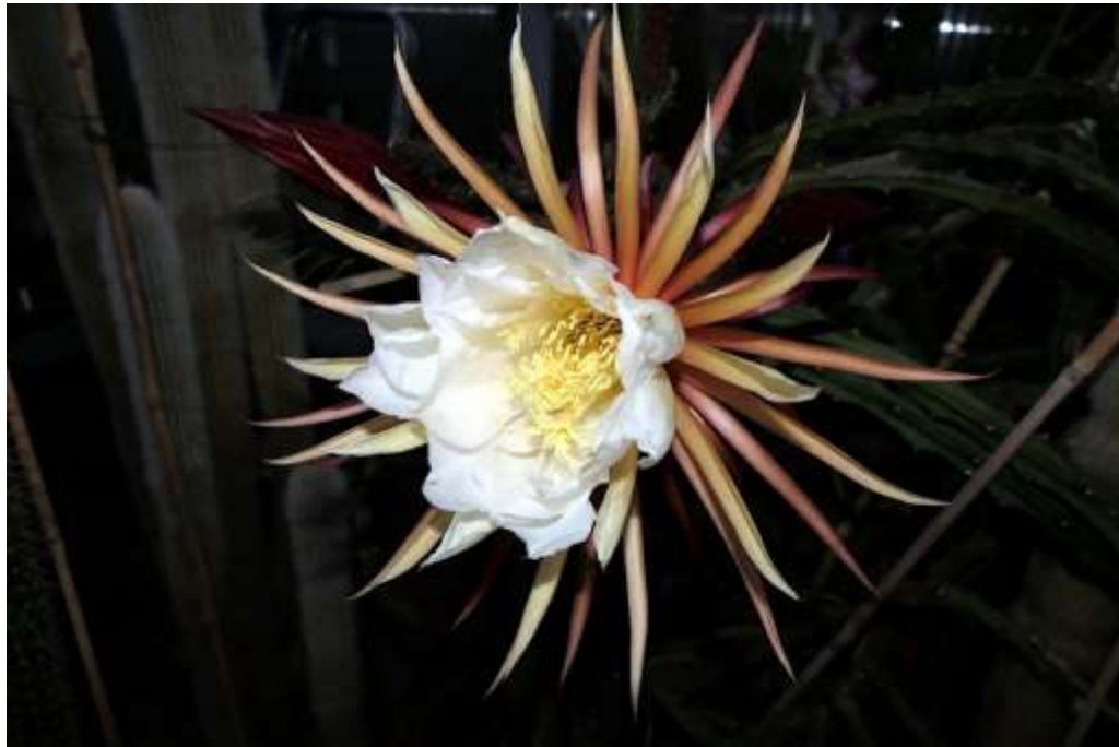
Selenicereus grandiflorus (Sporbi)