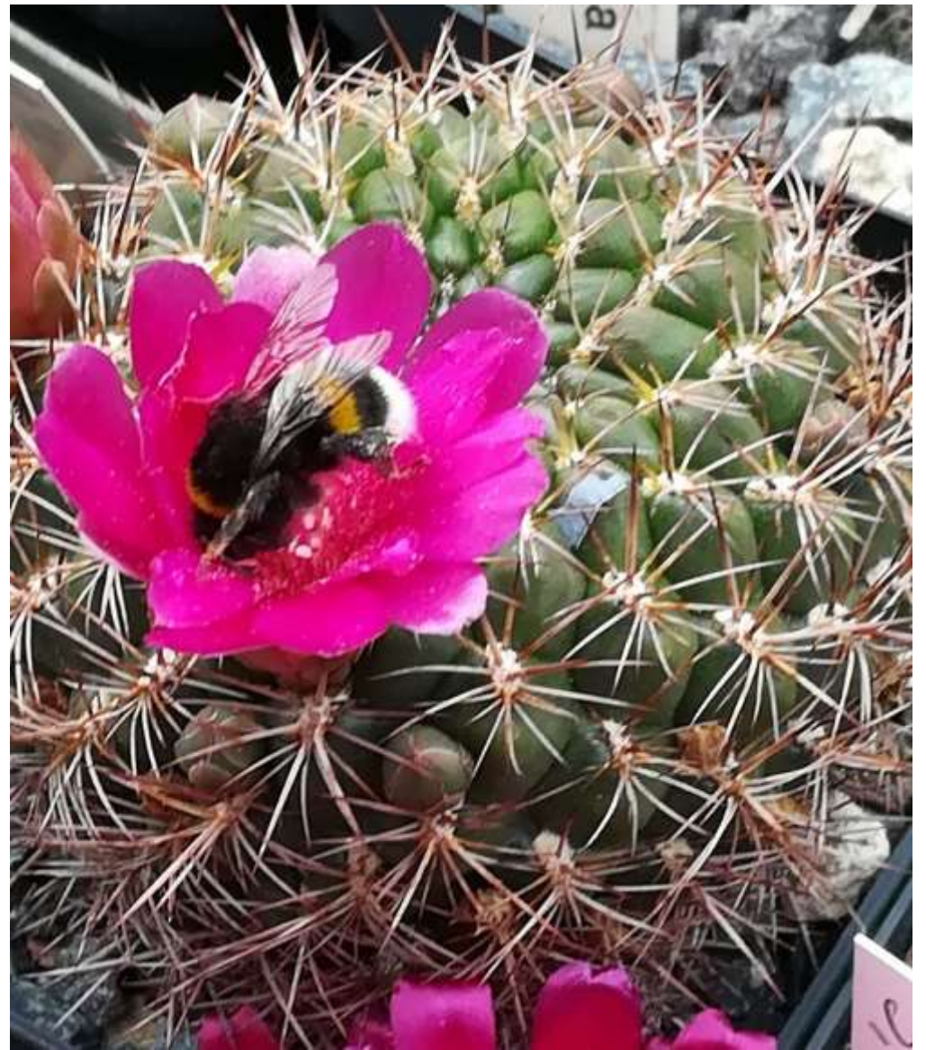
Sulcorebutia santiaguensis mit Erdhummel als Hybridiseur