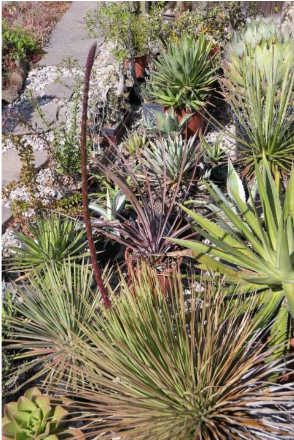
Agave stricta (35-40 Jahre) mit Blütenstand in Entwicklung