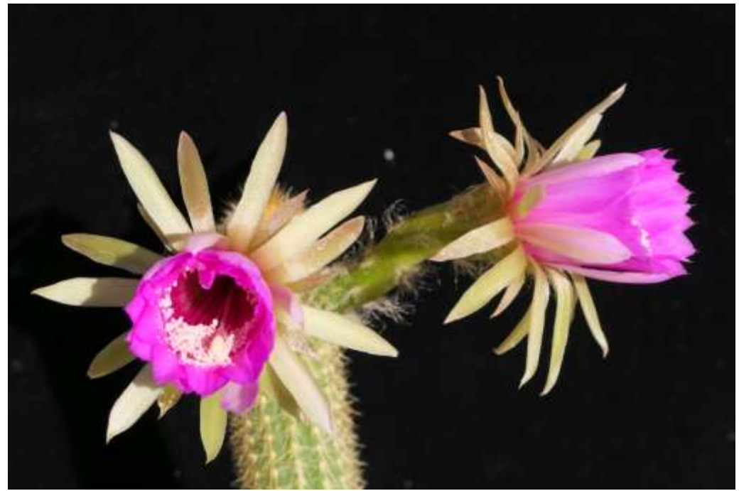
Arthrocereus rondonianus (erste Blüten 15 Monate nach Aussaat)