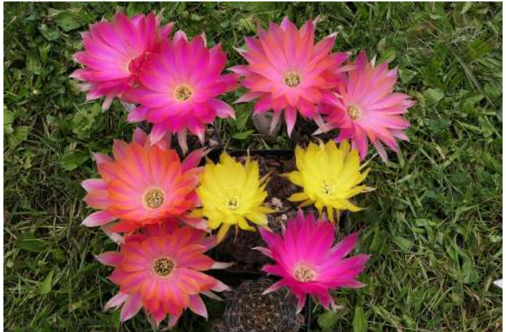
Lobivia winteriana x arachnacantha (gelbe Bl. Lob. arachnacantha )