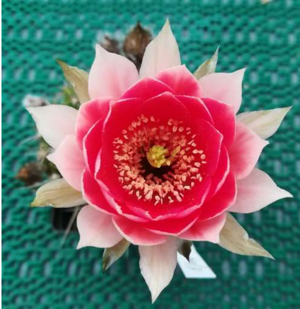
Lobivia – Hybride

Es gibt zum vorletzten Male neue Bilder. Mit der Nr. 20 wird Corona-Special wieder eingestellt.