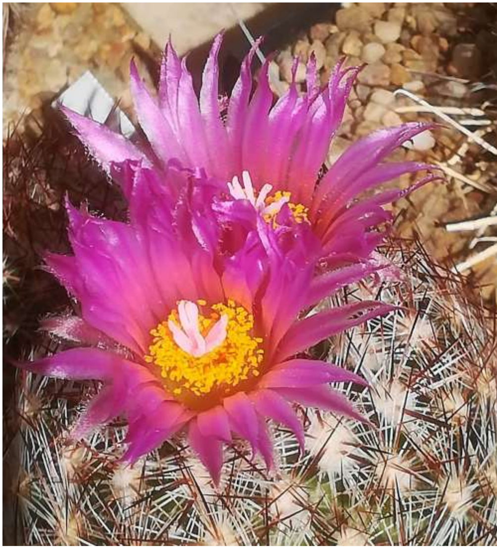
Escobaria vivipara Lz 046