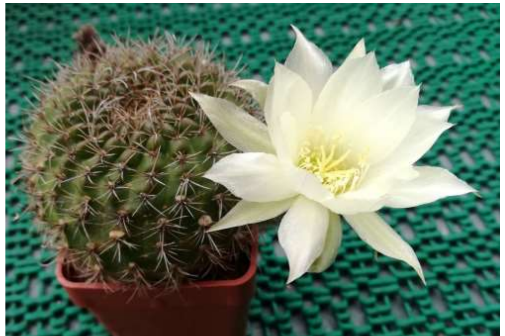
Lobivia – Hybride