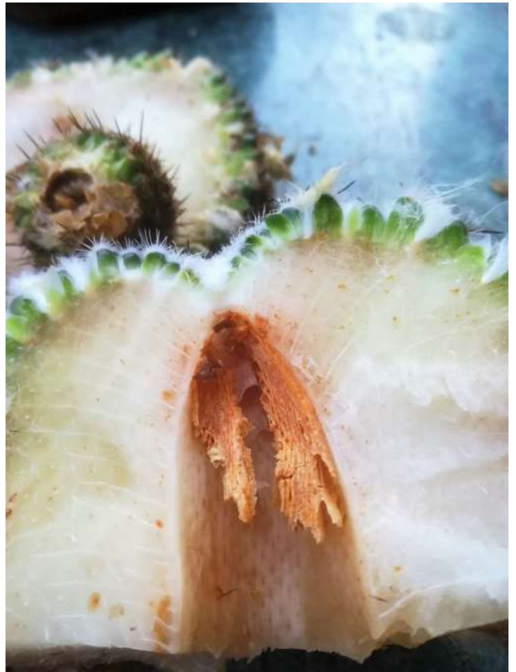
Hier hat ein Pilz zugeschlagen: Völlig zerstörter Leitbündelzylinder von Mammillaria albata „San Ciro“