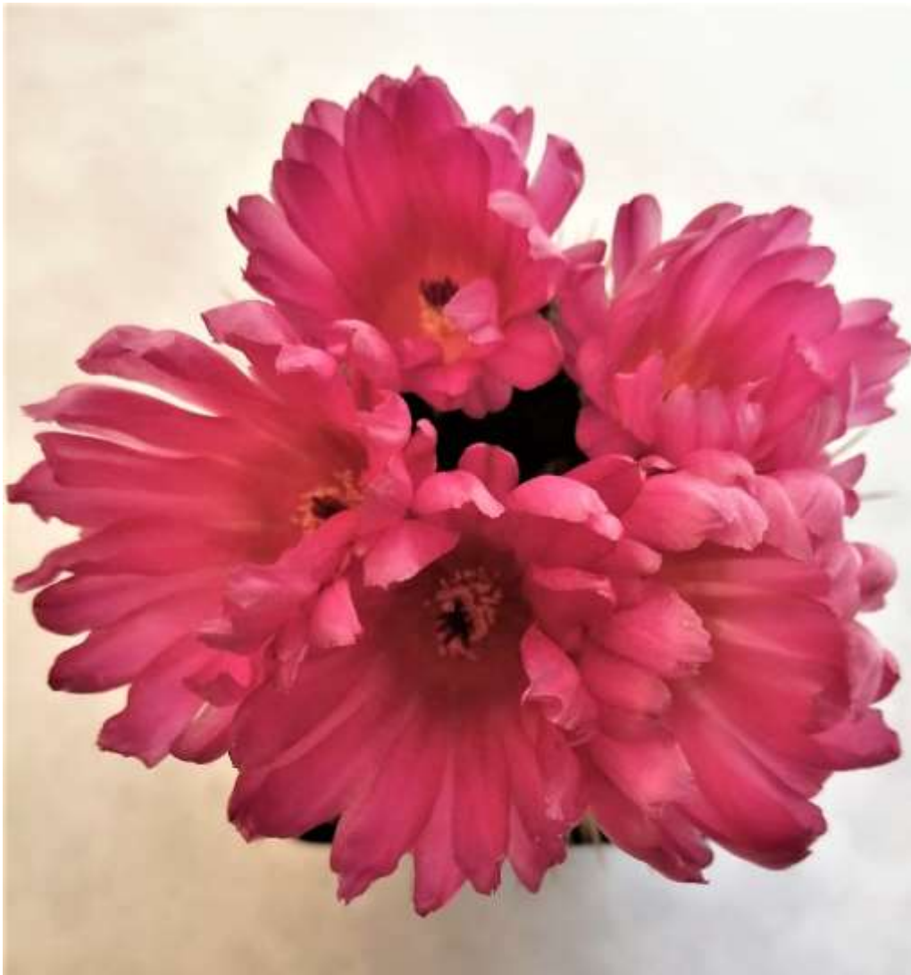
Notocactus submammulosus (seltene rotblühende Form)