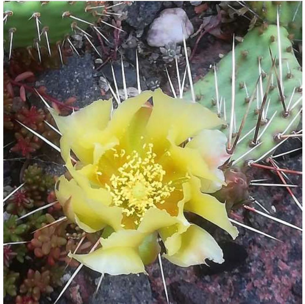
Opuntia phaeacantha (nicht rhodantha)