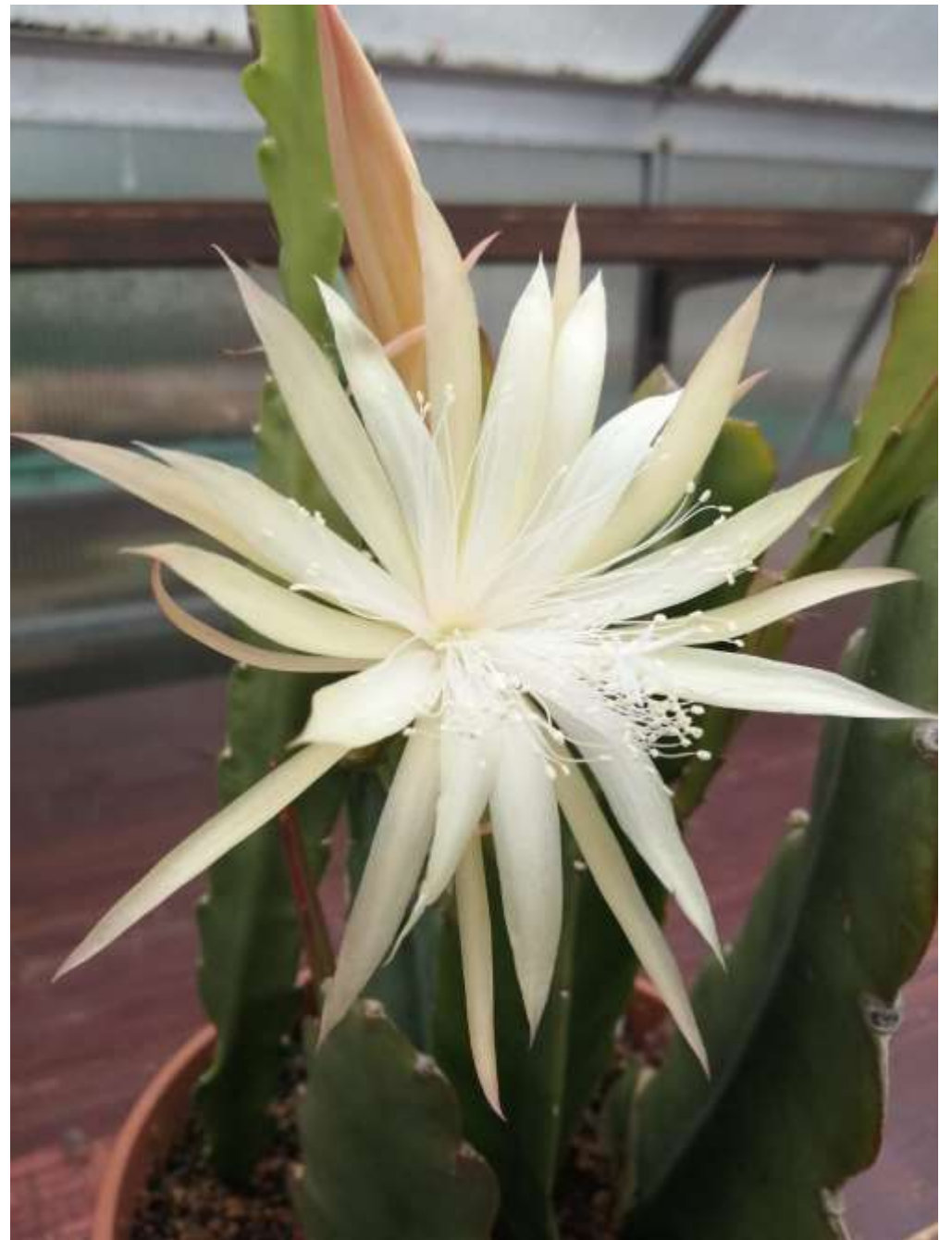
Epiphyllum-Hybride "Natascha Paetz" gibt es auch in weiß