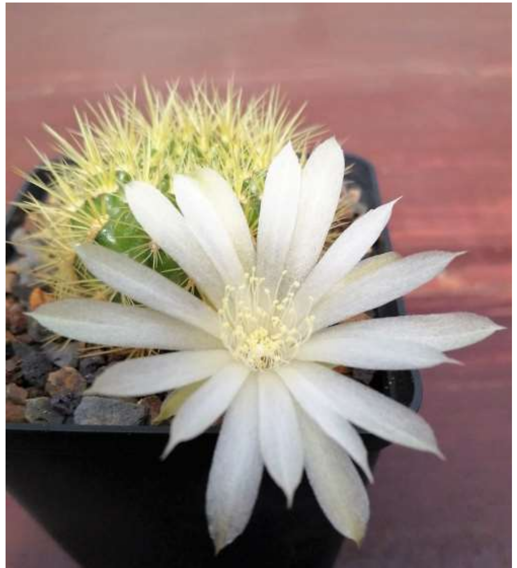
Sulcorebutia mentosa WR 277