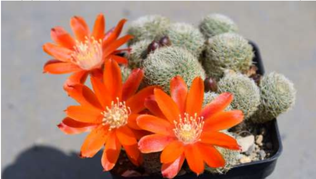
Aylosteria heliosa var. theresae