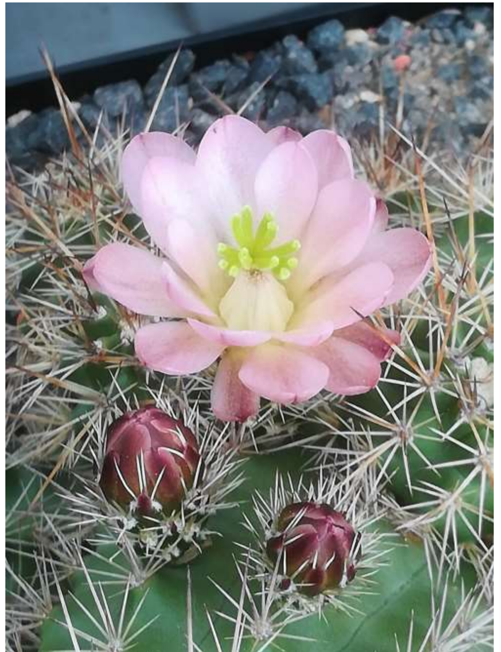
Echinocereus coccineus mit bisher unbekannter Blütenfarbe