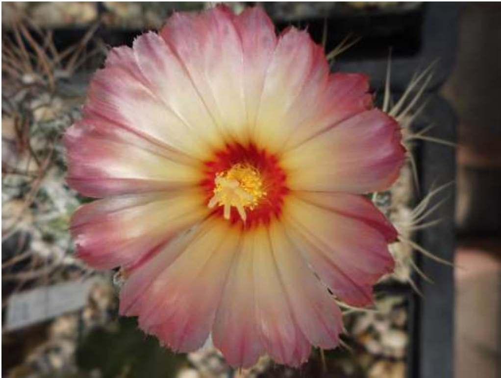
Astrophytum-Hybride „Rainbow“ ( asterias x senile v. aureum )