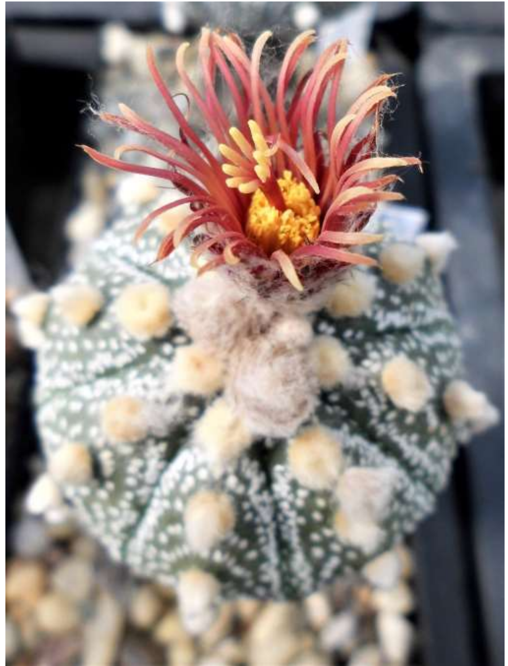
Astrophytum-Hybride asterias cv. akabana "Red Sh(i)owa" ist nach dem japanischen Kaiser Showa benannt.