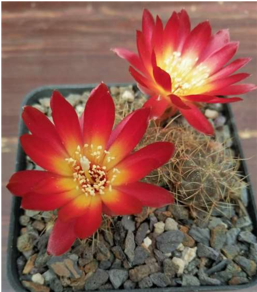
Sulcorebutia tarbucoensis var. tarabucoensis