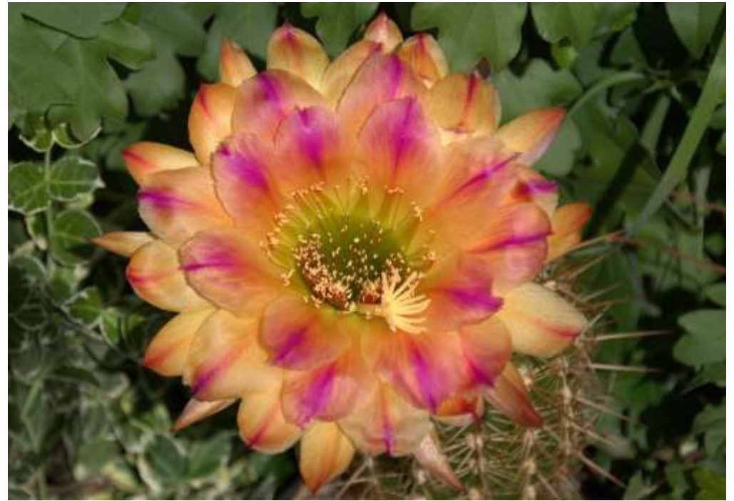
Trichocereus-Hybride „Pink Stripes“ Tönnies