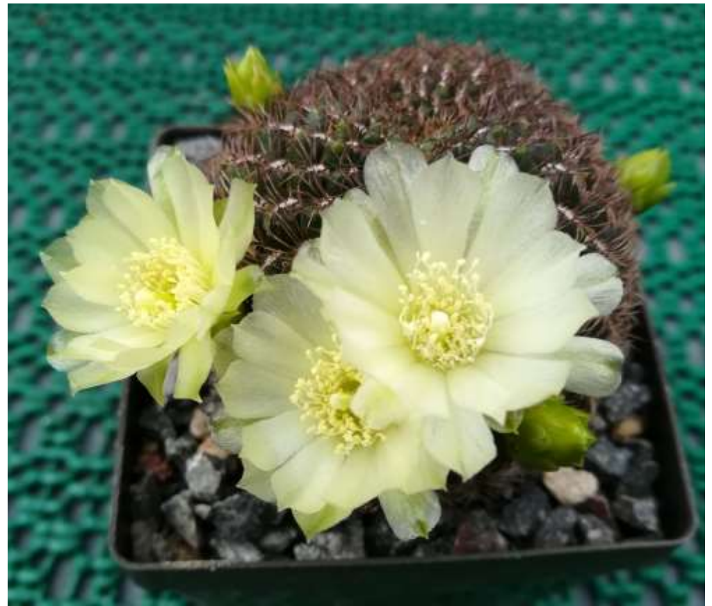
Sulcorebutia santiaginensis FR fma.