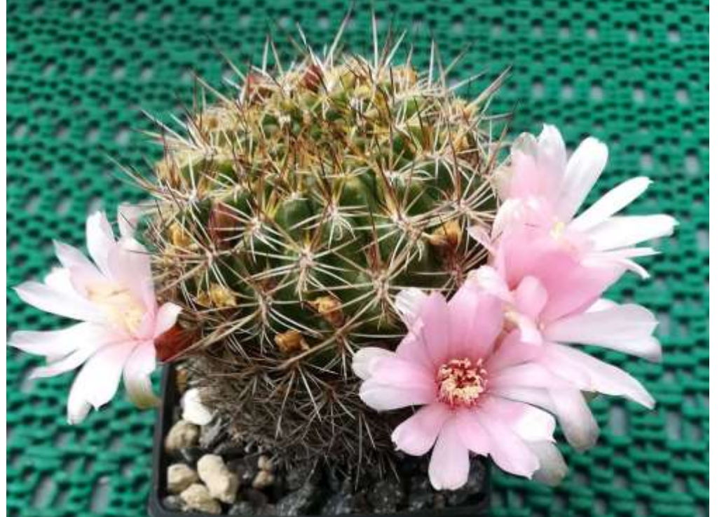
Sulcorebutia cylindrica var. crucensis