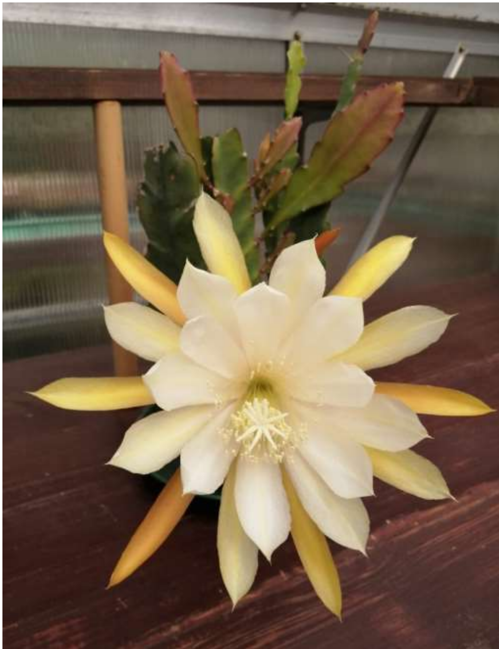
Epiphyllum-Hybride „Maxi Kelley“ 7770