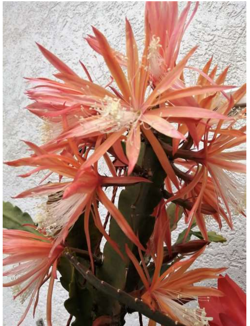
Epiphyllum-Hybride „Natascha Paetz“ Duftend!