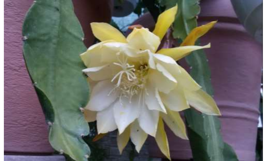
Epiphyllumhybride „Myrah“ (Clownklasse)