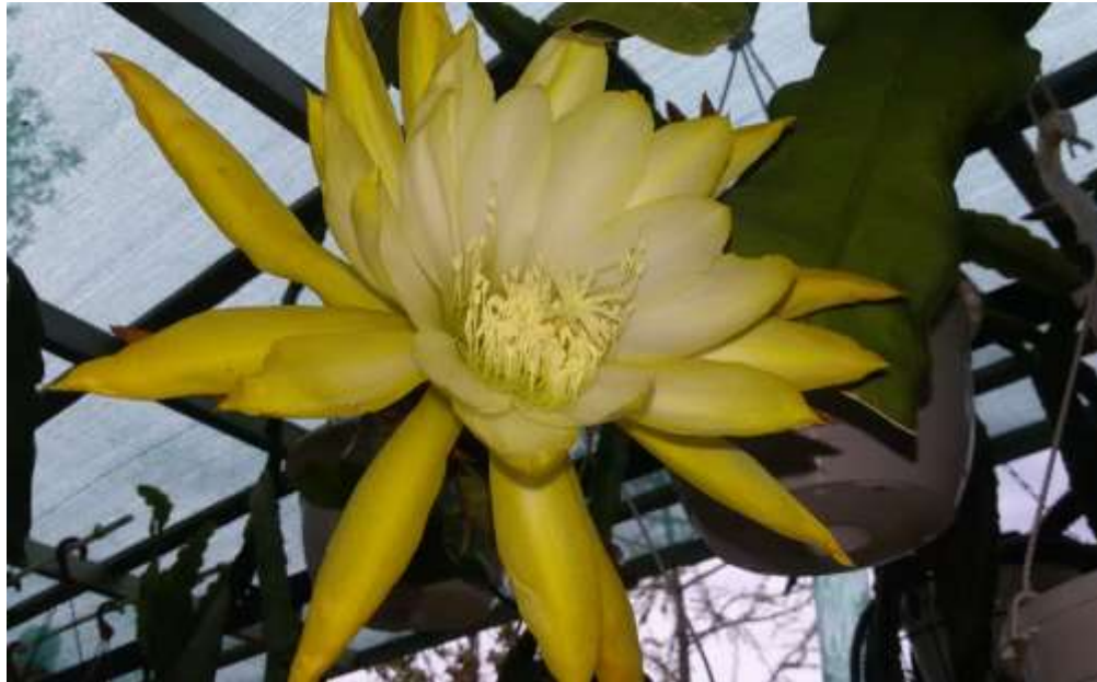
Epiphyllumhybride „Tele Ann“