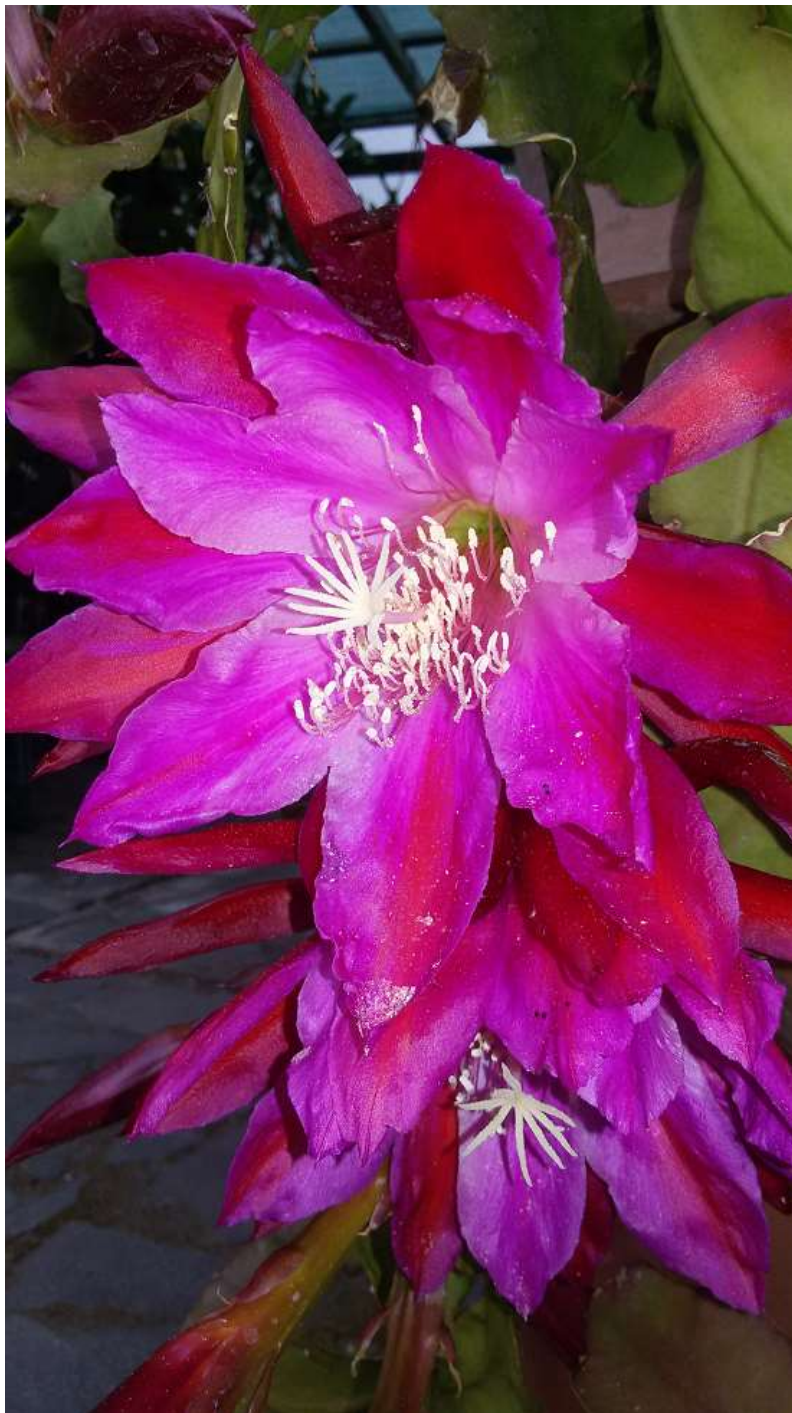
Epiphyllumhybride „Emett Kelly“

Nachdruck, auch auszugsweise, ist mit Genehmigung der Redaktion bzw. des Textautors gestattet. Für den Inhalt der einzelnen Beiträge sind die Verfasser verantwortlich. Beiträge und Spenden auf Konto Sparkasse Leipzig: IBAN: DE 11 8605 5592 1100 0045 52; BIC: WELADE8LXXX