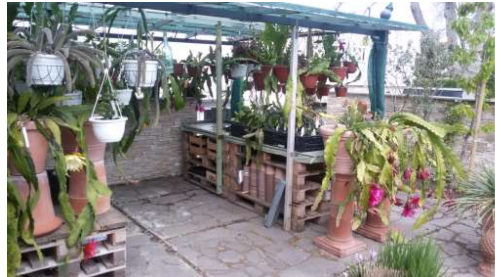
Blick in die Sammlung – Sommerquartier