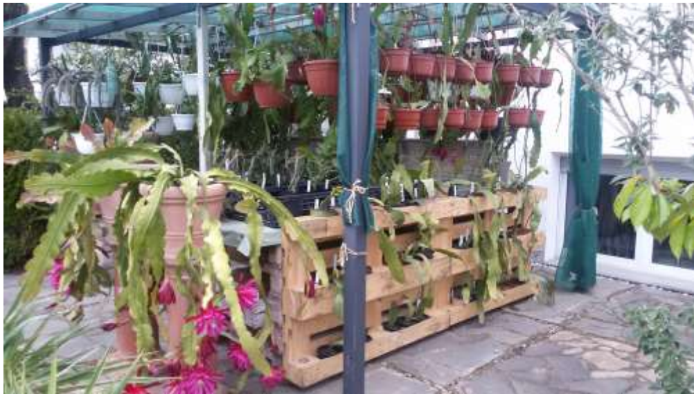
Aufstellung der Jungpflanzen in beschatteter Südlage im Sommer