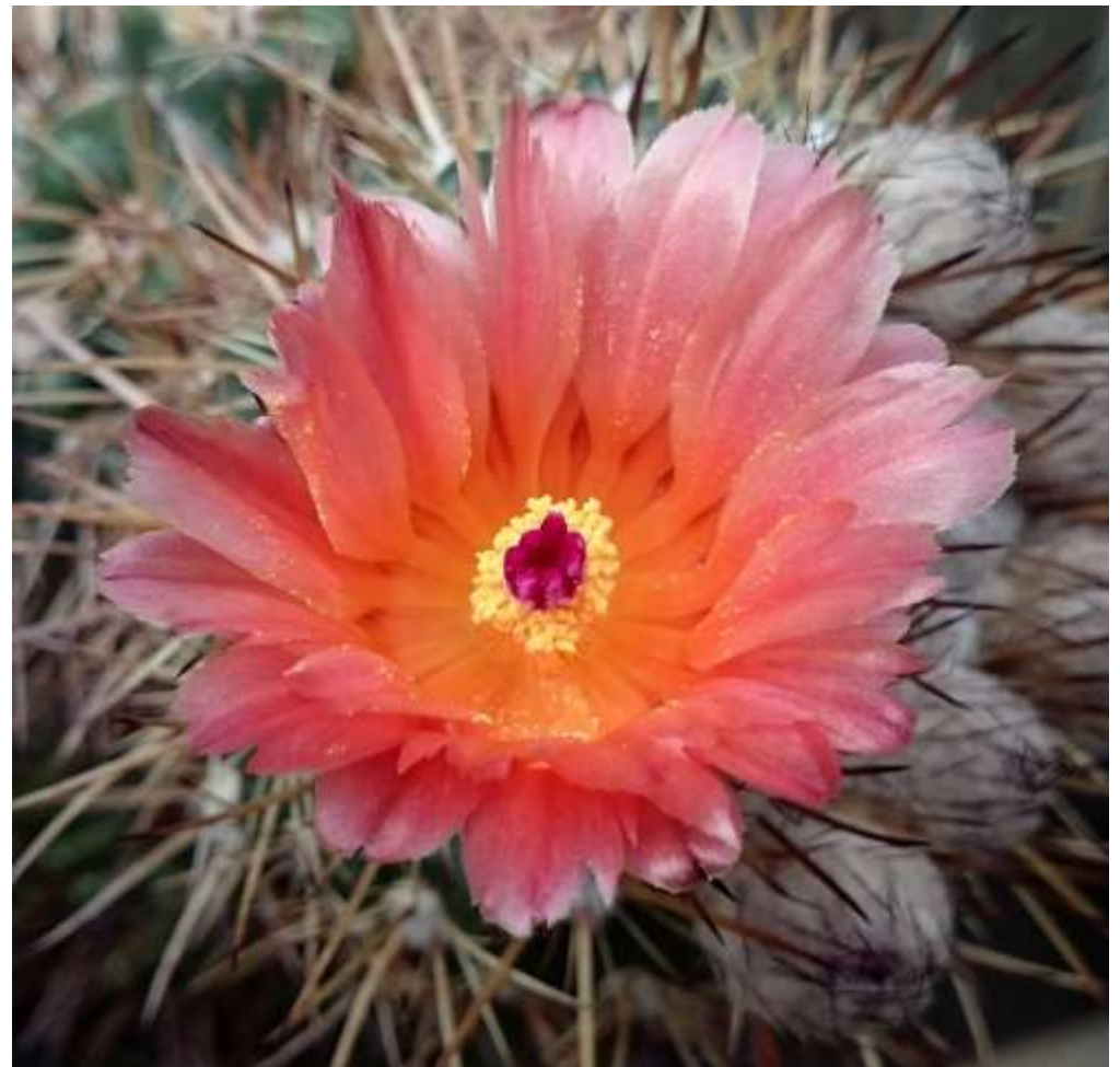
Notocactus submammulosus hybr.