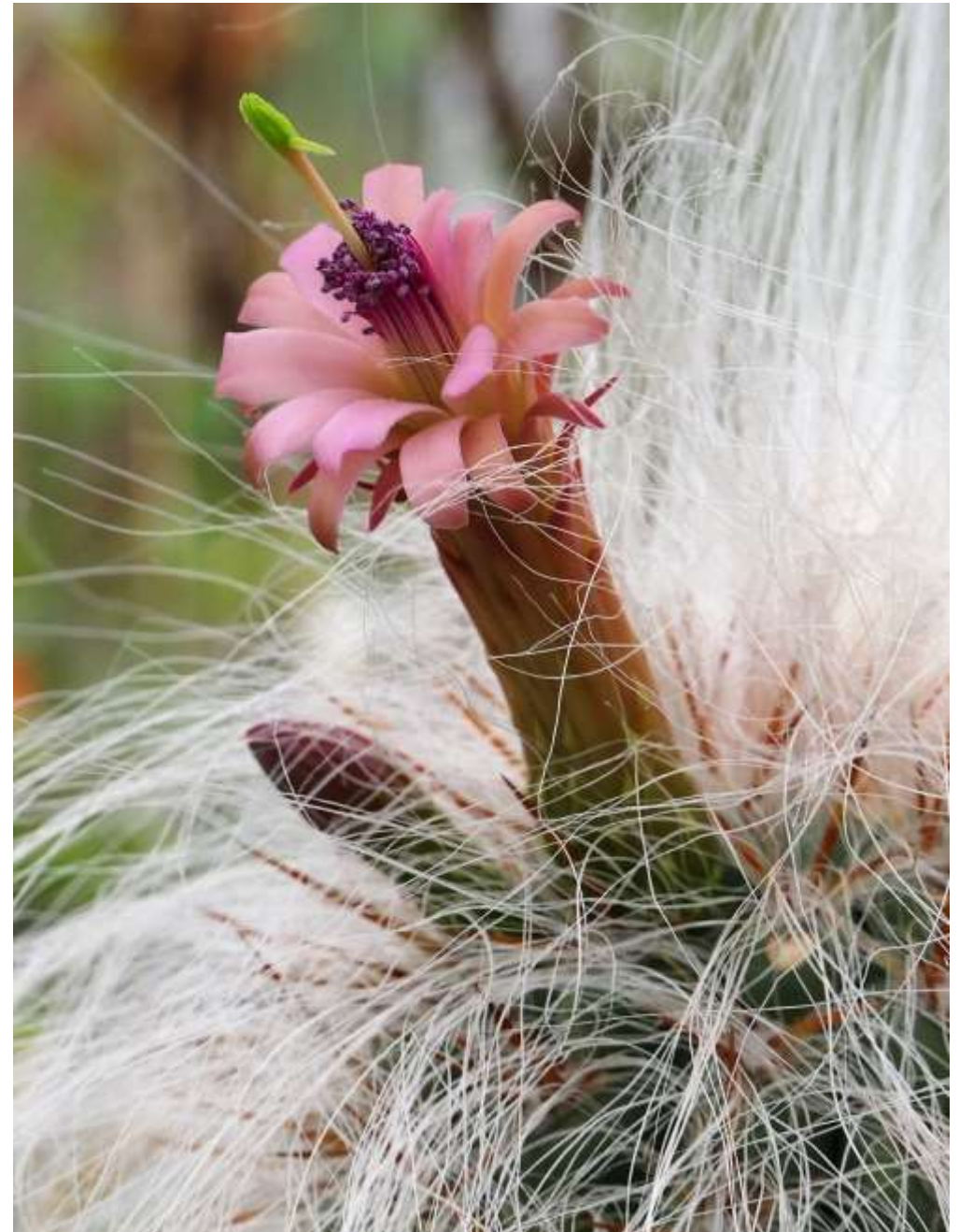
Oreocereus celsianus (erste Blüte nach 23 Jahren)