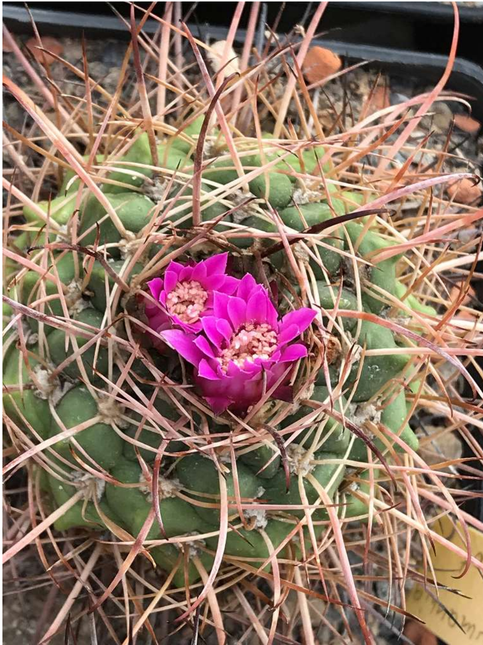
Neowerdermannia vorwerkii (besonders dunkel blühende Form von Jupp Noack)