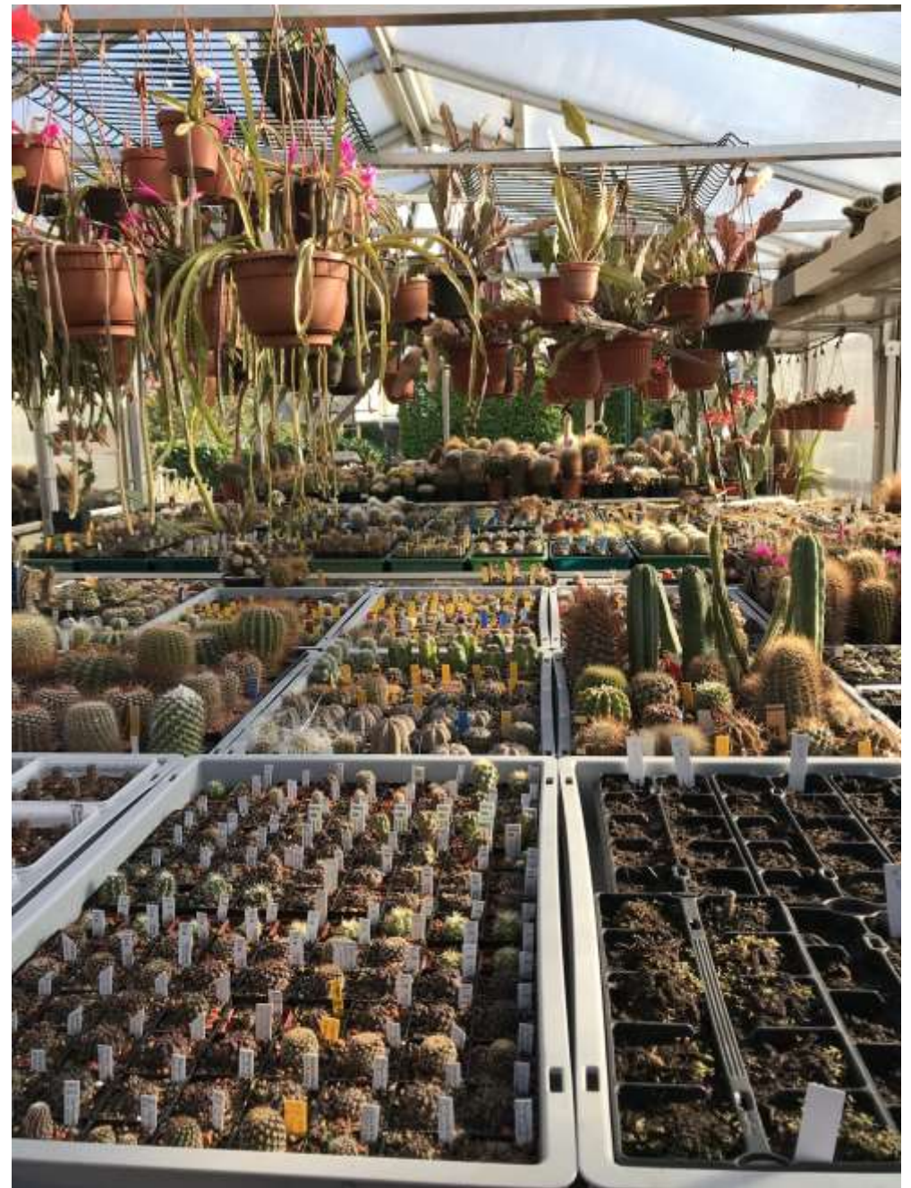
Blick in ein Gewächshaus bei Reinhardt Müller