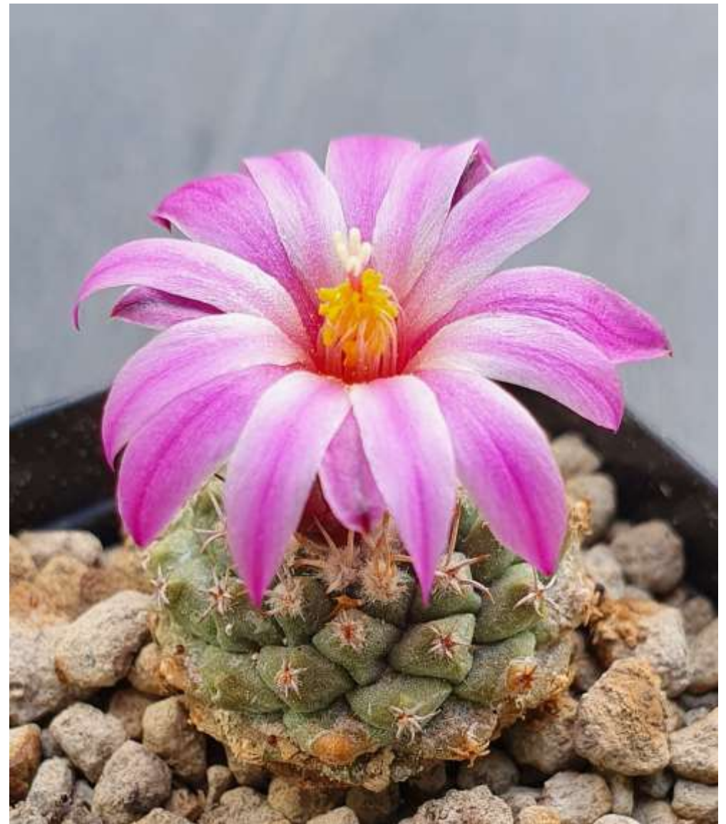
Strombocactus disciformis (seltene Form mit rosa Blüte)