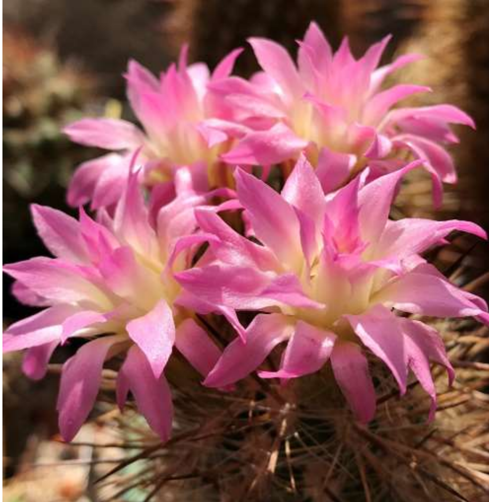
Eriosyce subgibbosa – Form von Zapallar