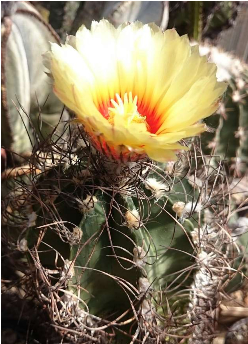
Astrophytum capricorne (früher: senile )