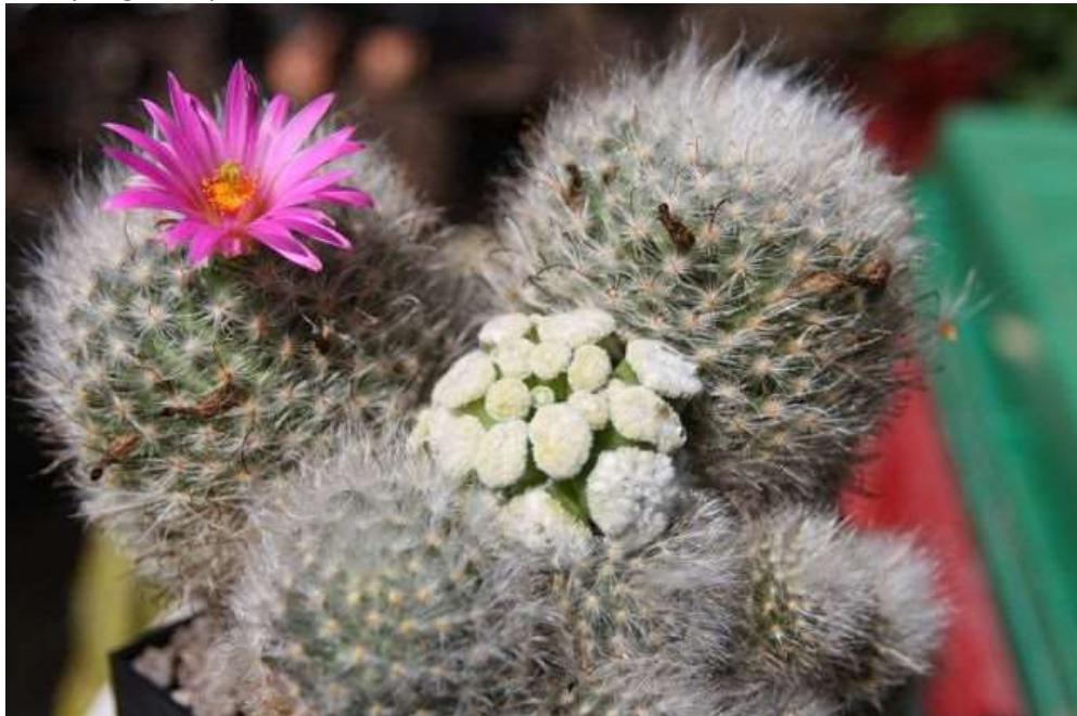
Mammillaria guelzowiana (monströse Form)