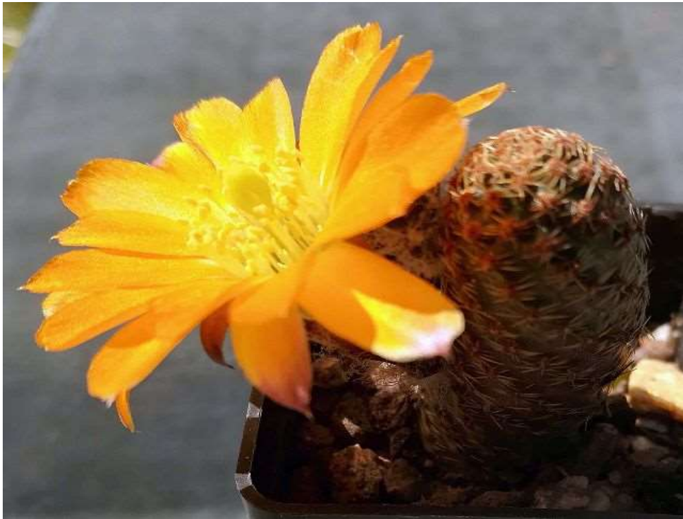
Mediolobivia diersiana var. minor