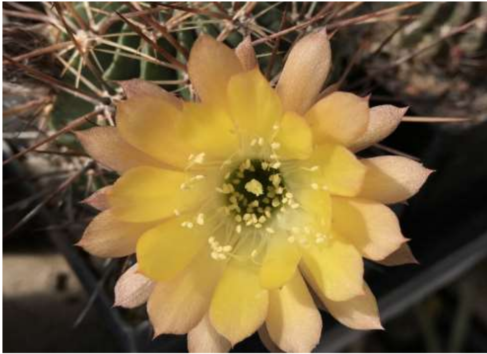
Lobivia lateritia var. cotagaitensis