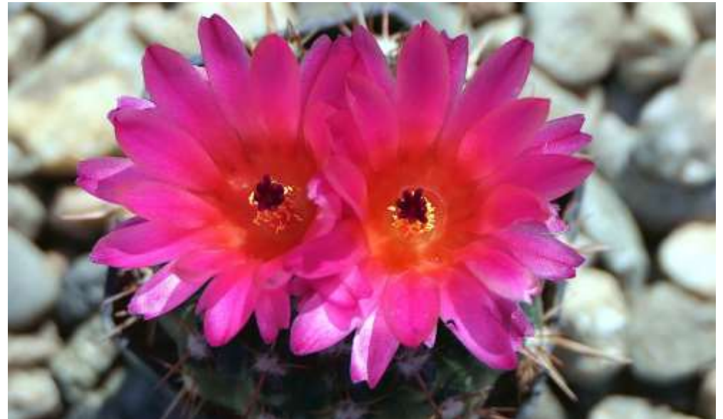
Notocactus submammulosus var. minor