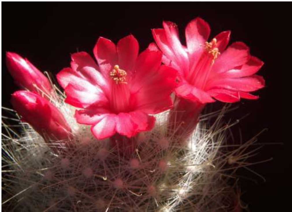
Mammillaria senilis. Die Pflanze steht seit 2017 ganzjährig auf dem Balkon. Für Frostresistenzversuche bitte selbst aussäen!