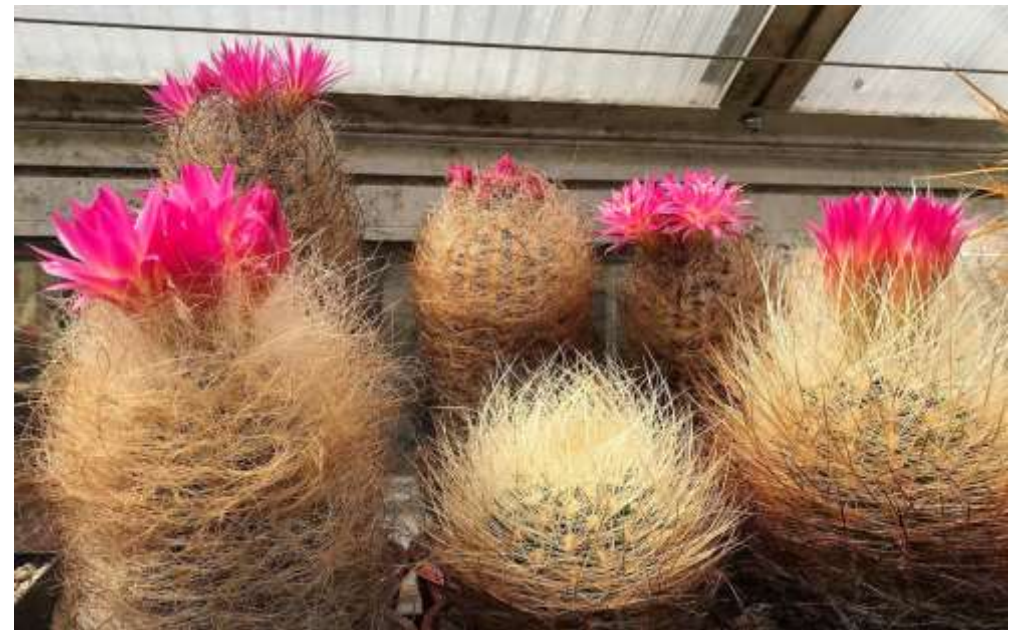
Eriosyce senilis – Formen