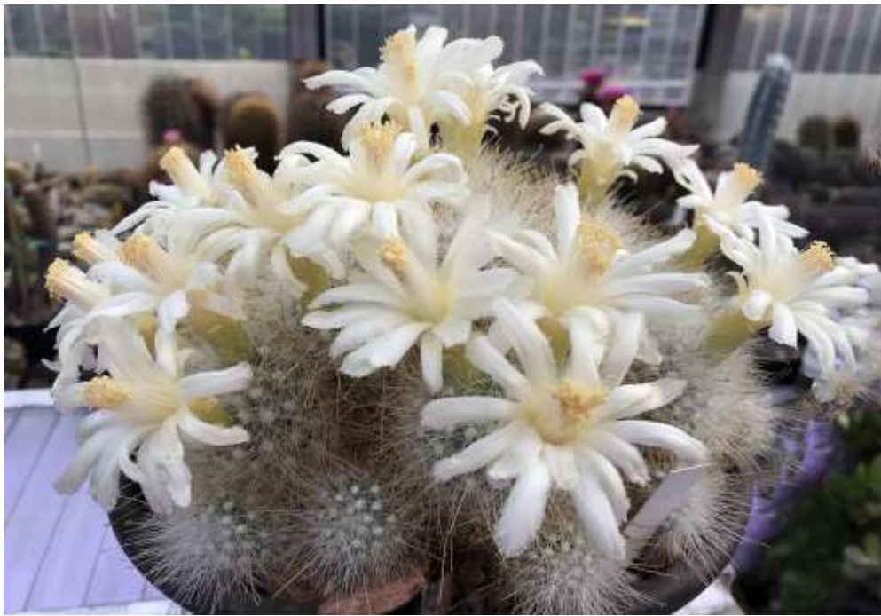
Mammillopsis senilis kann auch weiß blühen