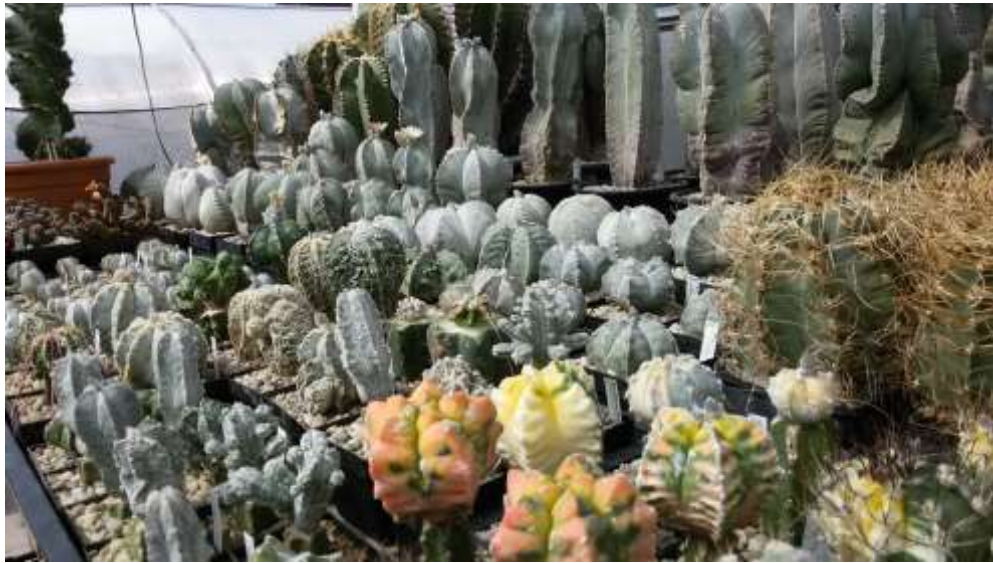
1. Blick in die Astrophyten der Sammlung Harport