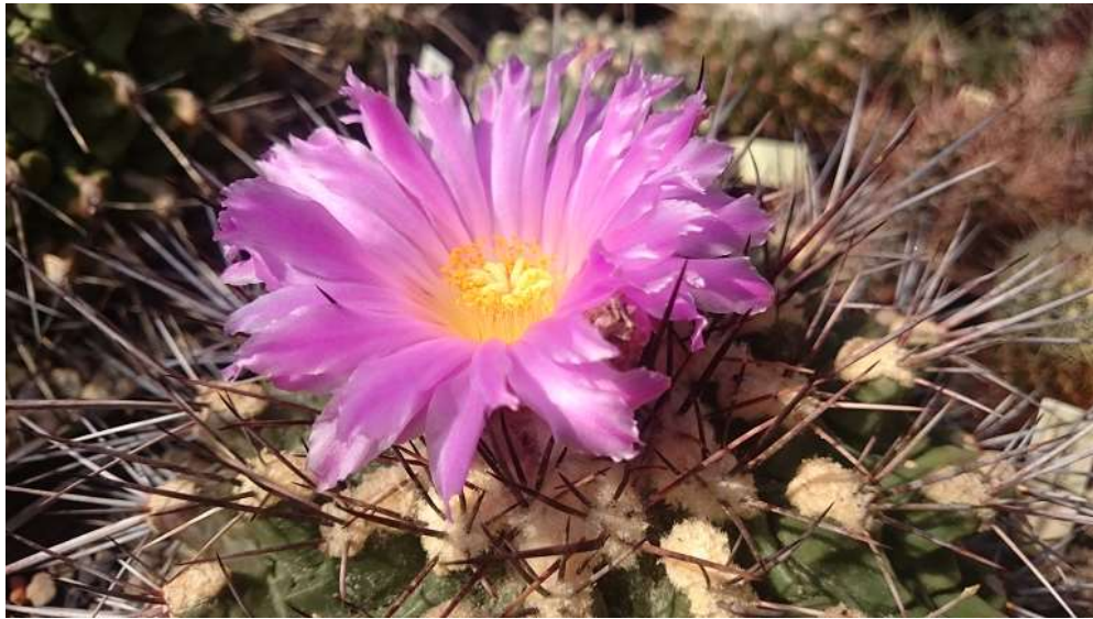
Thelocactus rinconensis v. freudenbergerii