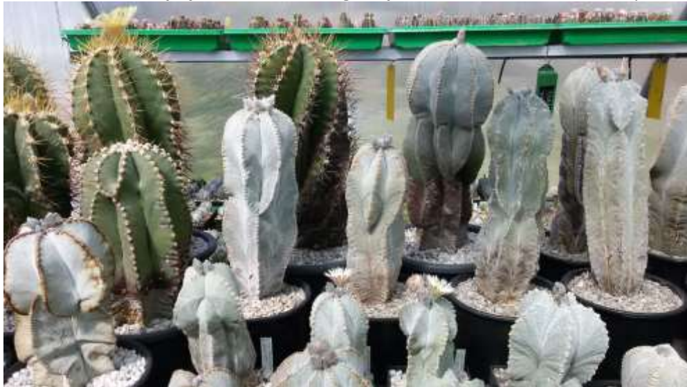
2. Blick in die Astrophyten der Sammlung Harport