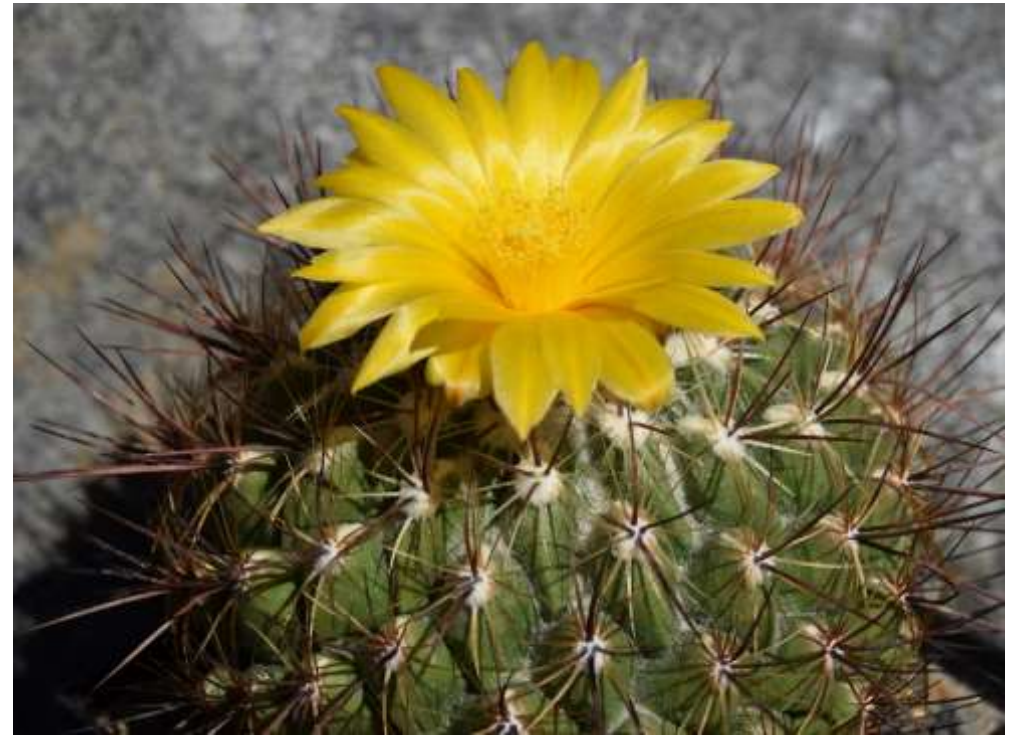
Thelocactus conothelos mit seltener Blütenfarbe