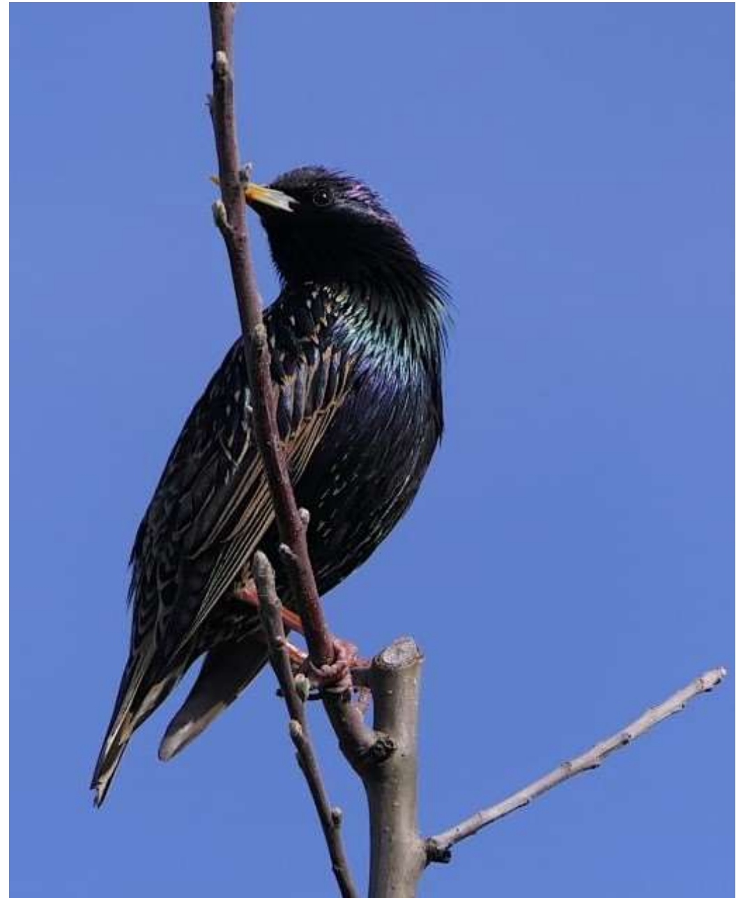
Sturnus vulgaris (Star) als Untermieter bei Kellers