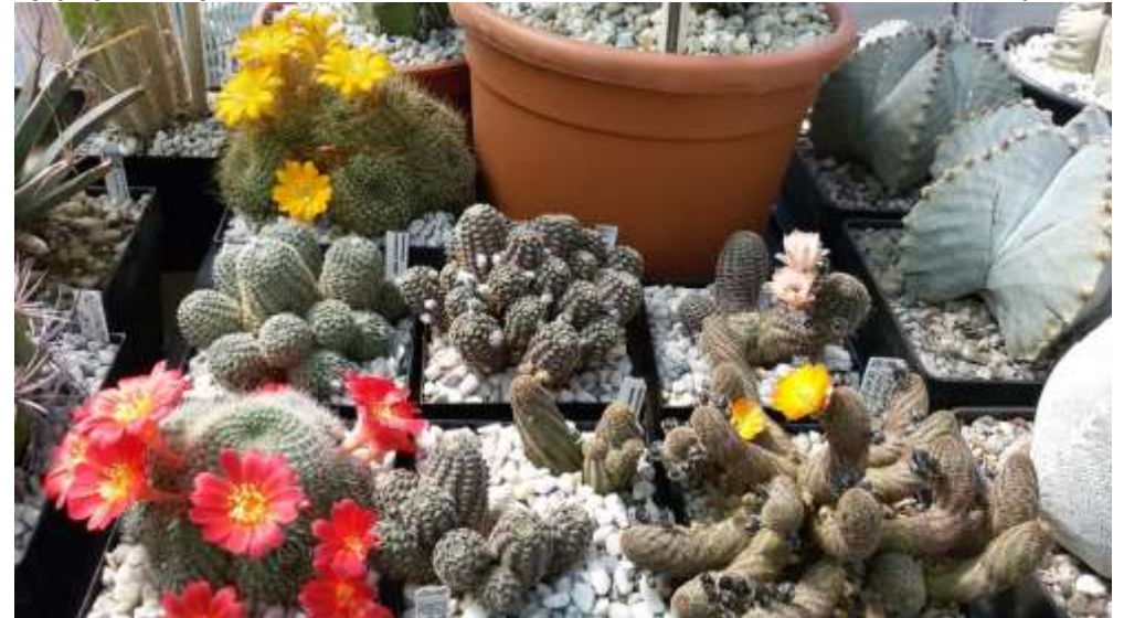
Blick zu den blühenden Rebutien