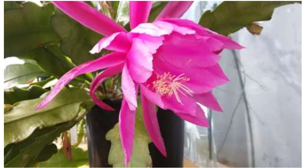
Epiphyllum-Hybride „Grand Ovation“